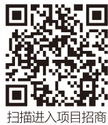
扫描进入项目招商

项目选址位于红河县宝华镇撒玛坝万亩梯田景区核心的苏红古村，占地133亩，将遵循“静、软、轻”的设计原则，修旧如旧，重新赋予老宅生命与灵气，并配合撒玛坝景区环线，引入商家一起建设，将苏红古村打造成以民宿为主，多业态并存的小型精品旅游目的地。