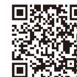
扫描进入项目招商

石屏县是猕猴桃的适宜种植区，石屏猕猴桃具有早熟、品质极佳的特点。石屏卓易农业科技开发有限公司作为云南省级农业产业化重点龙头企业，引领带动了高原山地猕猴桃种植产业的发展。本项目拟依托石屏县卓易公司，通过招商引资，建设集育种、种植、加工、冷链物流、观光休闲、科普培训、餐饮住宿等功能于一体的猕猴桃庄园，成为中国知名的猕猴桃产业创新园区、红河州知名旅游景区。