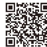
扫描进入项目招商

红河县位于红河谷生态环境最优良地区，畜禽养殖业发达，2019年全县年末存栏生猪14.5余万头，牛7.7万头，羊5万头，家禽168.5万羽，全年肉类总产量2.8万吨。目前，畜禽产品深加工在红河县仍是空白，周边县市尚无规模以上的加工企业，畜禽产品加工业的发展潜力巨大。