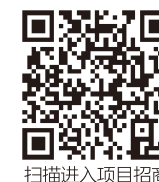
扫描进入项目招商

项目拟建成红河县集农特产品展示、交易、农产品加工、贮藏、现代物流、电子商务、小微企业创业园为一体的大型综合性批发交易市场；同时建设游客集散、旅游观光长廊、特色小吃等旅游配套设施。