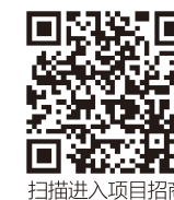
扫描进入项目招商