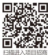
扫描进入项目招商

在泸西县中枢镇太阳坡片区建设物流城项目势在必行，作为泸西县城的物流中心综合区，该片区将以专业市场贸易及城市配送为主，打造一个具有商贸、物流、仓储转送等基本功能，并有金融、生活、货运等配套服务功能，同时具有货物调剂、咨询服务、包装加工、培训服务等增值服务功能的现代化综合物流园区。