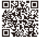
扫描进入项目招商

元阳县南沙镇，最高海拔1110米；最高气温43.5℃，最低气温10℃，年平均气温20℃,全年无霜，是冬季养生度假的优选之地。项目拟建设于元阳县南沙镇呼山村委会甘蔗山片区，该地区紧邻县城交通便利，有可开发土地面积约5000余亩，气候适宜，水资源丰富。