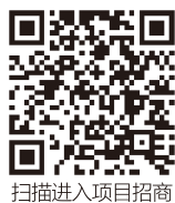
扫描进入项目招商

红河现代花卉产业是省农业厅和红河州委、州政府共同推动建设的省、州、县重点建设项目，该项目紧跟区域产业发展规划，承接花卉种植产业转移，依托区位优势和花卉种植产业的蓬勃发展，打造“集花卉交易、购买商服务、物流服务、金融服务、信息服务、技术服务、电商服务”等为一体的综合性花卉产业服务平台。